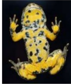
Photo de la face ventrale

Le crapaud sonneur à ventre jaune, Bombina variegata , est une espèce d'Amphibien qui fait partie des espèces vulnérables et menacées. Elle fait l'objet d'une protection en France.